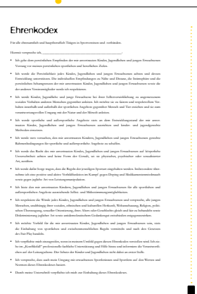
Siehe Seite 33

Der Ehrenkodex unterstützt die Haltung der Übungsleiter/-innen, Trainer/-innen und sonstiger ehrenamtlich und hauptberuflich Tätigen im Sportverein. Für diese Personen stellt der Ehrenkodex einen Anlass dar, sich über die Werte und Normen im eigenen Verein auszutauschen und sich die eigene Verantwortung gegenüber Kindern und Jugendlichen zu verdeutlichen.